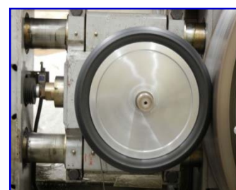
タイヤ走行試験機