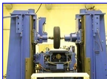
静的タイヤ試験機