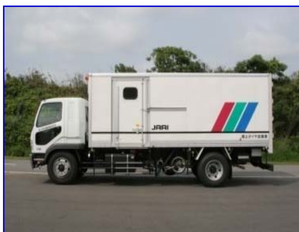
路上タイヤ試験車