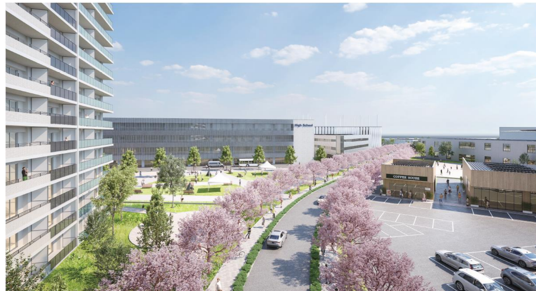
西側からInclusive Parkをのぞむ